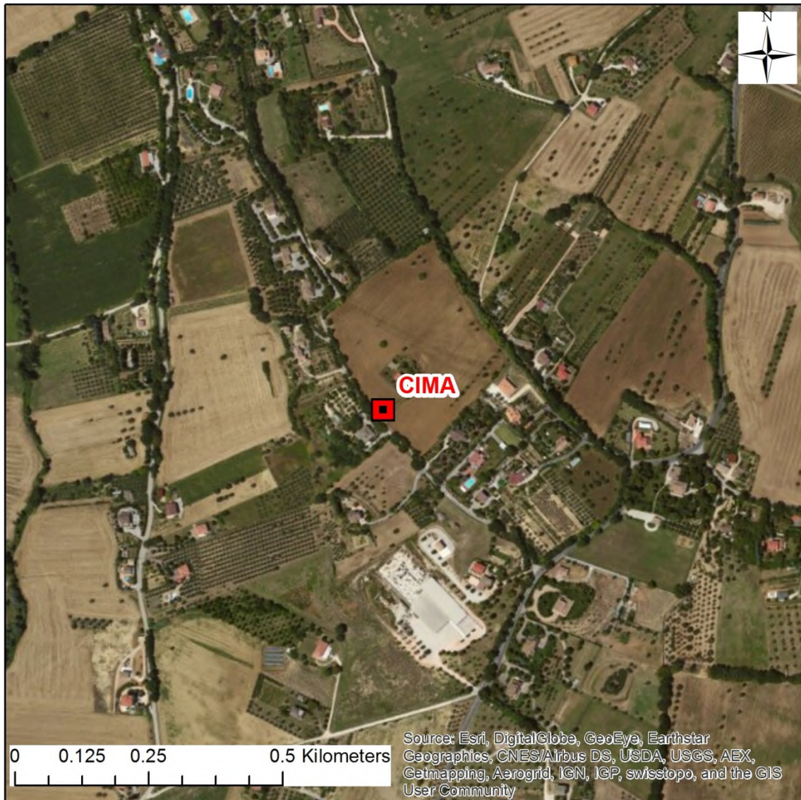
Stralcio dell'ortofoto in scala 1:10.000 con l'ubicazione della Stazione Sismica.