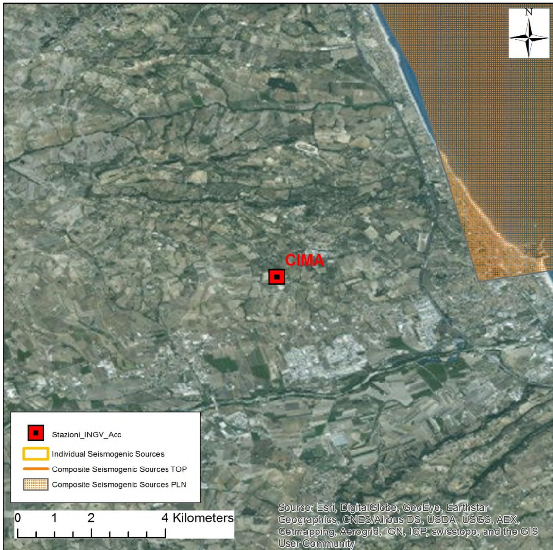
Stralcio dell'ortofoto in scala 1:100.000. La Stazione è collocata a circa 4 km ad ovest della Composite Seismogenic Source, denominata Conero Onshore.