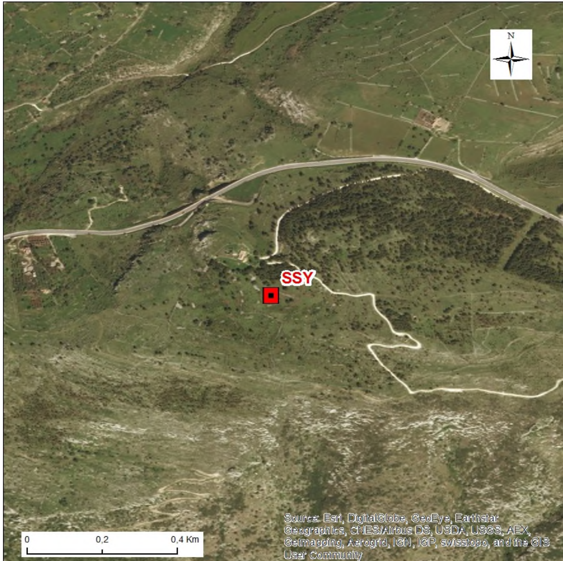
Stralcio dell'ortofoto in scala 1:10.000 con l'ubicazione della Stazione Sismica