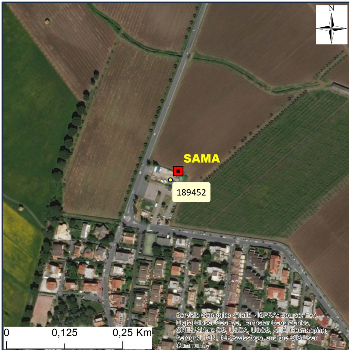
Stralcio dell'ortofoto in scala 1:5.000 con l'ubicazione della Stazione Sismica e del pozzo geognostico estratto dall'Archivio nazionale delle Indagini nel sottosuolo (Legge 464/1984) .