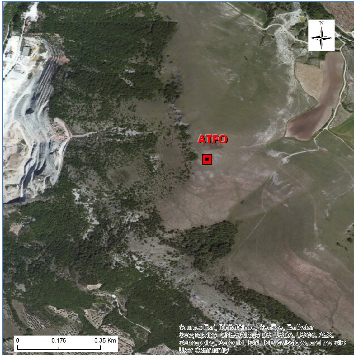
Stralcio dell'ortofoto in scala 1:10.000 con l'ubicazione della Stazione Sismica